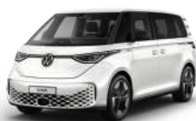
香草白 | B4B4