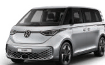
極光銀 | K9K9