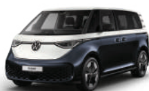
星空藍/香草白 | 9530