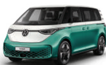
月桂綠/香草白 | 9675