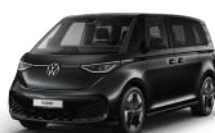
珍珠黑 | 2T2T