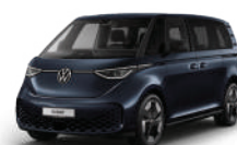
星空藍 | 3S3S