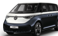
星空藍/香草白 | 9530