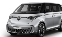
極光銀 | K9K9