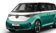
月桂綠/香草白 | 9675