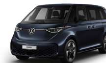
星空藍 | 3S3S