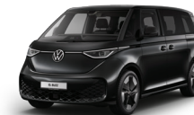
珍珠黑 | 2T2T