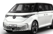
香草白 | B4B4