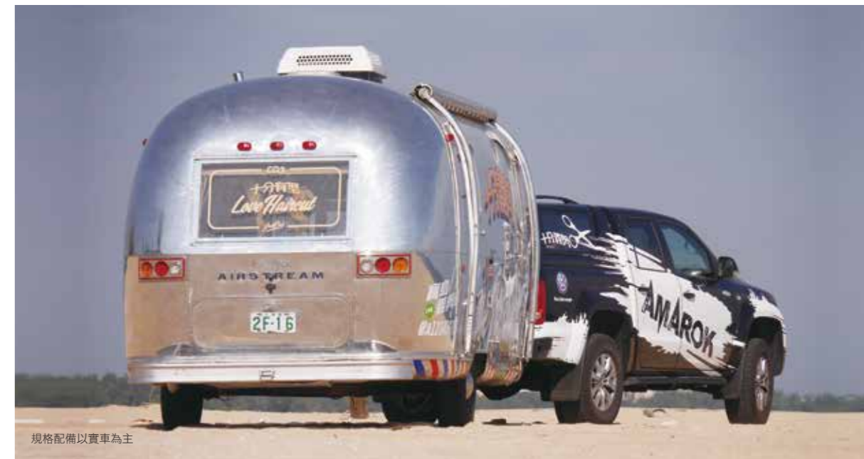
規格配備以實車為主

優異的紮實度和頂級外觀, 全新Amarok即使用在重度粗活, 也同樣令人驚艷。抗扭曲梯型車架保障絕佳車身耐用度, 特殊葉片彈簧最高可對應1噸載重與3.5噸尾車負載。