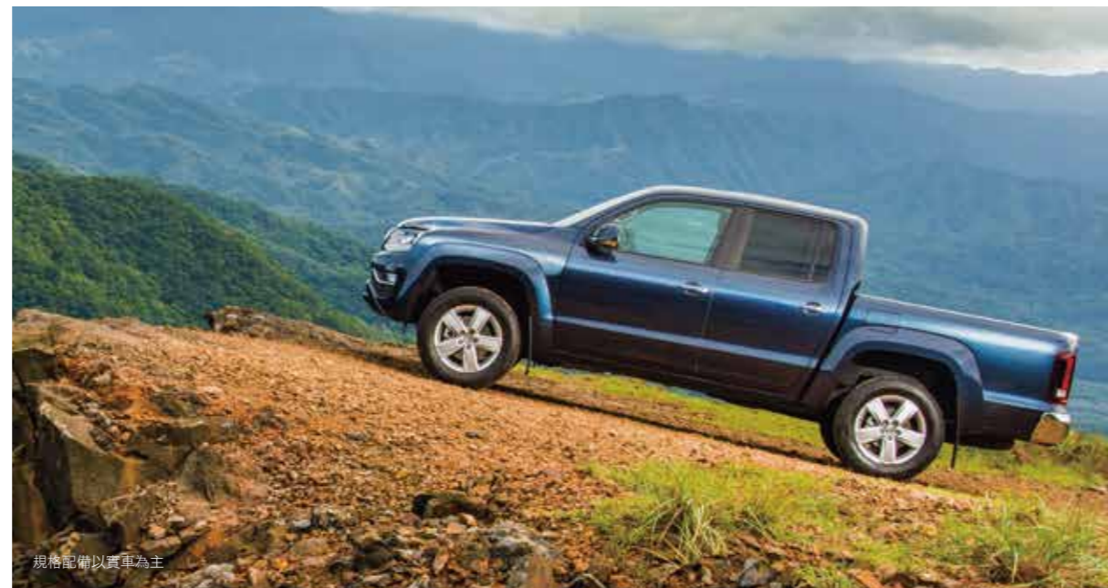
規格配備以實車為主

全新Amarok即使在最惡劣的條件下同樣能提供頂尖行車舒適性。這必須歸功於底盤與驅動系統校正的完美協調性- 搭配經過驗證的4MOTION全時四輪驅動系統, 有需要隨時都能大顯身手。傑出的Off-road ABS越野輔助功能也有助於在鬆軟地形縮短煞車距離。