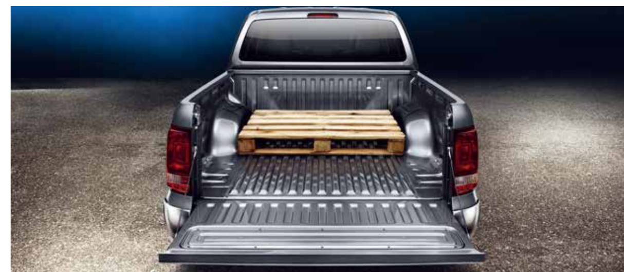
VOLKSWAGEN原廠保留針對上述規格修改之權利; 規格若有不符, 以實車為準。

德國生產的Amarok V6是同級距唯一提供4MOTION全時四輪驅動系統搭配8速Tiptronic手自排變速箱的貨卡。除了能大幅提升行車舒適性, 在艱難地形或者山區路段, 當其他車款達到極限時, Amarok卻堅決不妥協, 兼具機動性、靈活度與極佳性能, 遠超越其他車款。