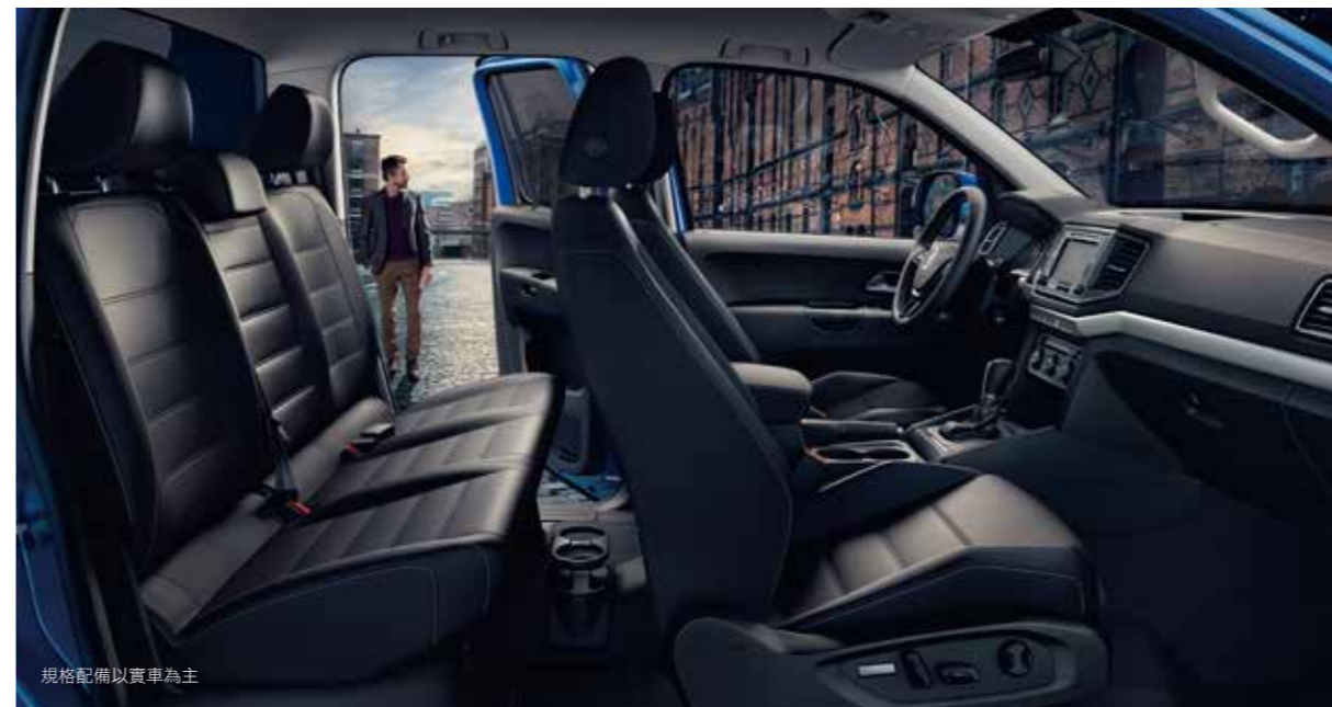
規格配備以實車為主

內裝自信展現空間、高度舒適性與多種頂級配備的完美組合。所有配備等級均搭載附飾件的全新設計儀表板, 以及A4大小置物箱。Amarok Aventura另配備有真皮包覆多功能方向盤附新設計的換檔撥片。有了附換檔撥片的真皮包覆式跑車方向盤, 就能完全掌控愛車- 多功能資訊顯示幕則能協助您留意各種事物。全新動力方向盤也提升了轉向反應並且營造出格外動感的操控回饋。