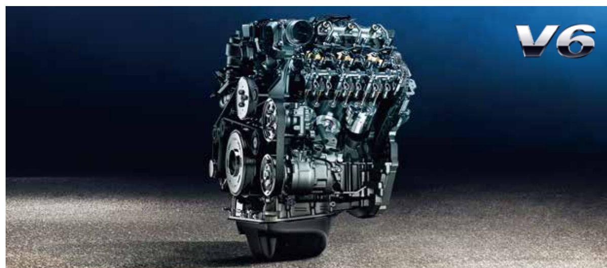
VOLKSWAGEN原廠保留針對上述規格修改之權利; 規格若有不符, 以實車為準。

全新Amarok配有3.0L V6渦輪增壓柴油引擎, 搭配八速Tiptronic 手自排; 以2,967cc的排氣量最高可輸出258匹馬力並可在1,400-3,000轉速時達到59.1公斤米的最大扭力表現(Aventura)。最大的動力來自先進的超增壓科技, 最多可榨出至272匹馬力(200kW)。