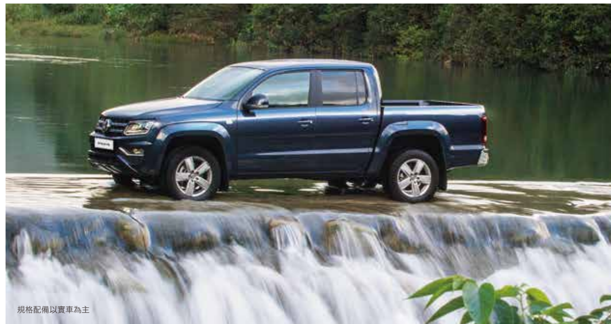
規格配備以實車為主

全方位的安全配備:全新Amarok為同級距唯一將MCB二次碰撞預煞系統, 17吋前碟式煞車系統*及16吋後碟式煞車系統列為標準配備的皮卡。此外, 拖曳穩定系統也能針對尾車擺動, 提供穩定功能, 提升行車安全。